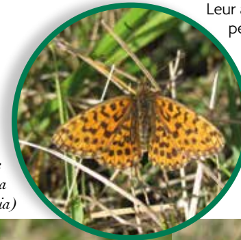
La petite violette ( Clossiana dia )

La Réserve Naturelle est riche de plus de 1700 espèces animales. Parmi elles, on trouve 1423 espèces d'insectes et 125 espèces d'araignées. Au sein des invertébrés, signalons 58 espèces de papillons de jour (dont près de la moitié à forte valeur patrimoniale), 27 espèces d'orthoptères (criquets et sauterelles) dont le très rare Criquet rouge-queue ( Omocestus haemorrhoidalis ) inféodé aux pelouses sèches. Le coteau est également connu pour être un des seuls sites du quart Nord-Ouest où sont inventoriées 9 espèces de zygènes (photo en couverture), dont le Zygène de Faust ( Zygaena fausta ). Enfin, 46 espèces d'oiseaux et 5 espèces de reptiles y ont été observés.