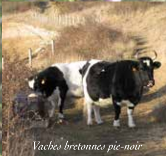
Vaches bretonnes pie-noir

Ce coteau fait partie des Monts d'Eraines et constitue ainsi leur limite sud. Il culmine à 156 m et présente un dénivelé de plus de 50 m. Sur les pelouses calcicoles, une végétation thermophile et xérophile (végétation des endroits chauds et secs) a pu se maintenir jusqu'à nos jours grâce à l'agropastoralisme traditionnel. Actuellement, ce sont des vaches bretonnes pie-noir et des chèvres communes de l'Ouest qui jouent un rôle majeur dans le maintien des pelouses et des espèces rares présentes sur la Réserve Naturelle.