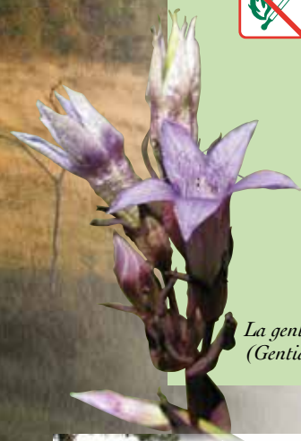
La gentiane d'Allemagne (Gentianella germanica)