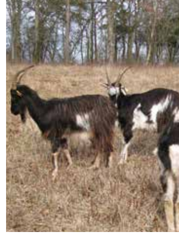
Chèvres communes de l'Ouest

Leur action permet de favoriser l'expression d'une flore remarquable et de maîtriser l'embroussaillage de ces milieux fragiles.