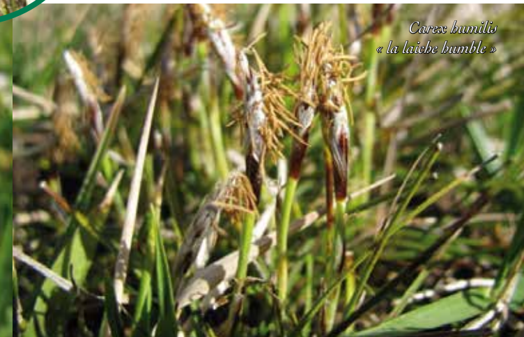
Carex humilis « la laïche humble »