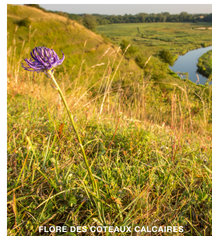
FLÔRE DES COTEAUX CALCAIRES

L'année 2021 sera consacrée à rencontrer les gestionnaires normands déjà impliqués dans la sauvegarde des tourbières et à construire ensemble un nouveau programme régional qui, nous l'espérons, verra le jour en 2022 !