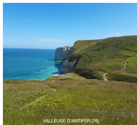
VALLEUSE D'ANTIFER (76)

Le CEN Normandie a candidaté et a été retenu à cet appel à projet en partenariat avec les associations Aquacaux et CARDERE . Le CEN Normandie sera chargé des suivis et inventaires scientifiques ainsi que la valorisation des ENS via des animations nature scolaires et grands publics.