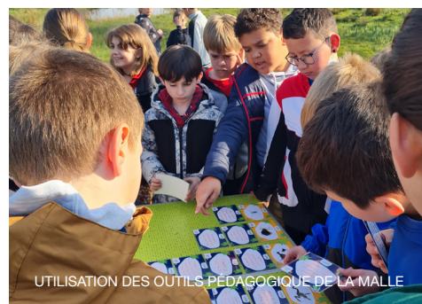
UTILISATION DES OUTILS PÉDAGOGIQUES DE LA MALLE