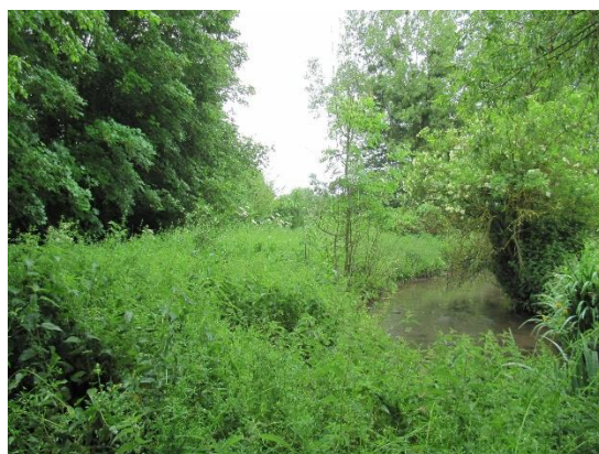
Site du Hamel à Condé-sur-Iffs signé en 2021