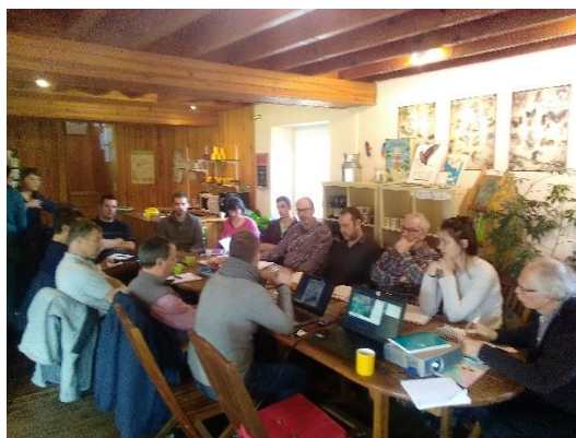
Comité réseau de sites PELE de mars à la maison de la rivière et du paysage au CPIE des Collines Normandes